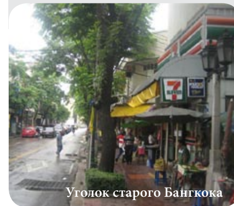
Уголок старого Бангкока

Прекрасен и огромный 6-этажный компьютерный гипермаркет Pantip Plaza. Ноутбуки в нем стоят минимум в полтора раза дешевле, а мелкие товары – дешевле в