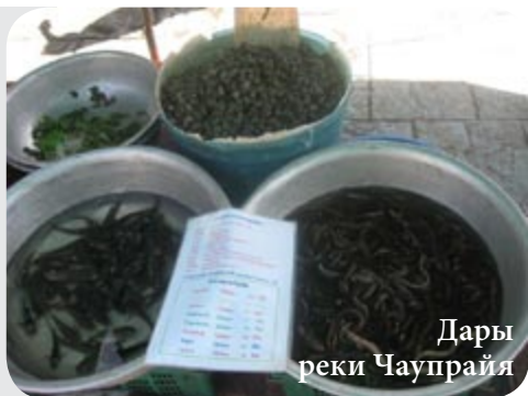
Дары реки Чаупрайя

Другие фрукты тут же нарежут, положат в пакетик и передадут вам вместе с острой деревянной палочкой (вместо вилки) и кулечком приправы, которая бывает нескольких видов. Самая острая и замысловатая – смесь перца, соли, сахара, лимонной кислоты и кориандра, который тайцы кладут буквально во все блюда.