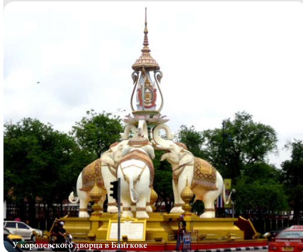
У королевского дворца в Бангкоке