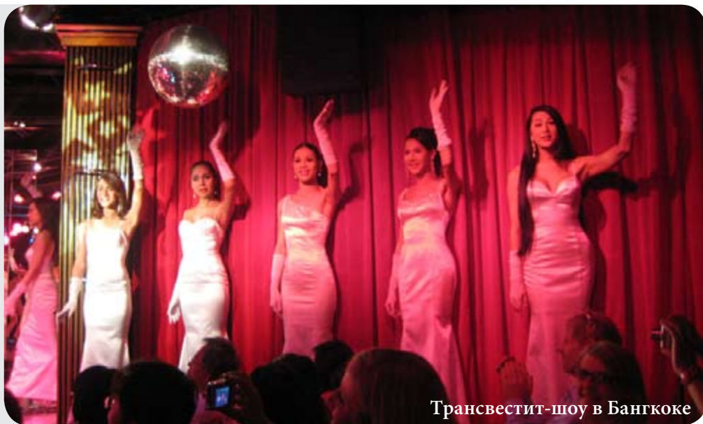
Трансвестит-шоу в Бангкоке

Bhumibhom) висят чуть не на каждом доме. Ну, а о том, что в кинотеатрах Таиланда перед началом сеанса исполняют гимн и всем необходимо встать, а того, кто не встанет, сажают в тюрьму за неуважение к королю, не писал только ленивый. Король ни во что не вмешивается и занимается выведением пород коров, выращиванием новых сортов растений и написанием стихов.