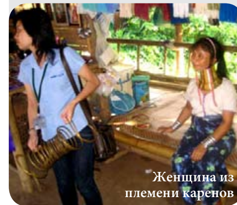
Женщина из племени каренов

Горы Северного Таиланда населяют племена каренов, вытесненных сюда за национально-освободительную борьбу с бирманским режимом. Карены живут в хижинах среди горных лесов, выращивают рис и занимаются скотоводством. Туристов к ним возят из-за необычного «наряда» местных женщин – закрученных в спирали латунных колец на шее и руках. Считается, что длинные шеи и руки